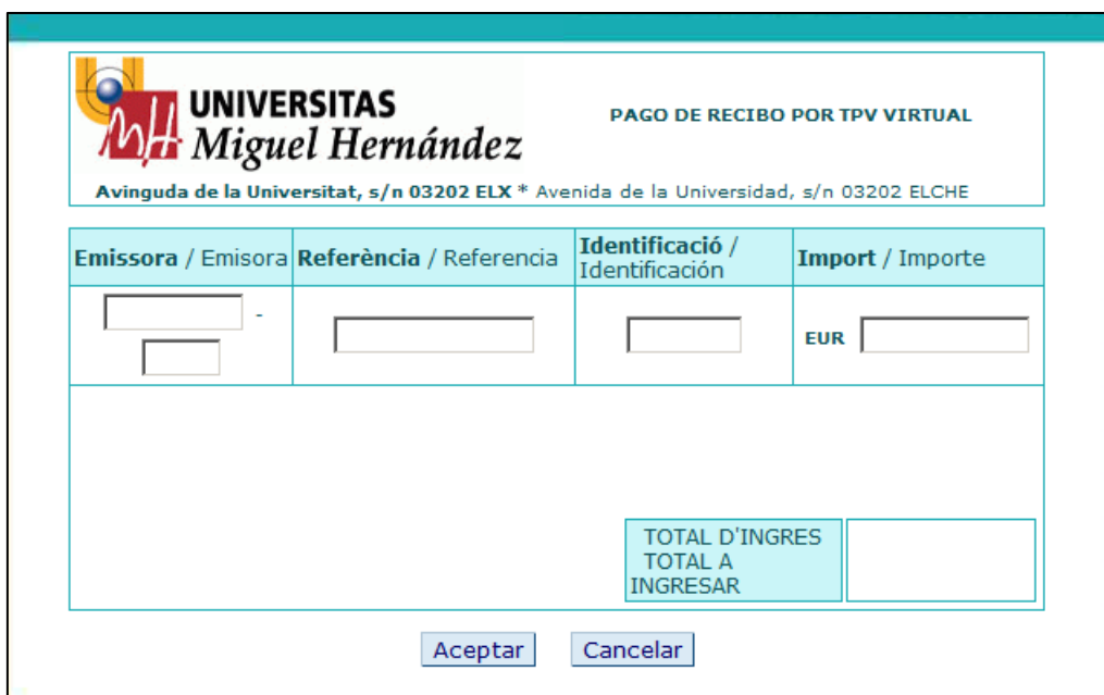
Figura 4. Pago virtual de la UMH

y allí deberás completar los campos con la información del recibo generado en el paso anterior (Emisora, referencia. Identificación e importe), y a continuación, podrás realizar el pago virtualmente.